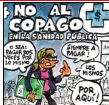
No al copago en la sanidad